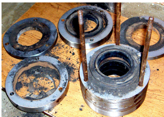
Рисунок 1 - Состояние сальника 1 ступени после разборки

1-я - ступень температура всасывания ( 35\pm 40^{\circ}\text{C} ), температура нагнетания ( 190\pm 200^{\circ}\text{C} ); 2-я - ступень температурах всасывания ( 60\pm 67^{\circ}\text{C} ), температура нагнетания ( 230\pm 235^{\circ}\text{C} ) На 29.01.09 г. компрессор проработал 18900 часов. Износ всех сальников и поршневых колец 2 ступени минимальный, не превышает 0,15 мм. Износ поршневых колец 1 ступени составляет 5,3-6,0 мм при наработке одного комплекта уплотнений около 8000 часов (цилиндры 1 и 2 ступеней были расточены для восстановления геометрии). В настоящее время компрессор продолжает работать без подачи масла в сальник и в цилиндры 1 и 2 ступеней. Отказов в рабочих клапанах не наблюдалось.