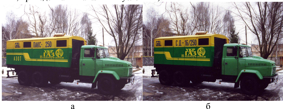
Рисунок 3 - Передвижная азотная компрессорная станция ПАКС-250 (а) и передвижная воздушная компрессорная станция СД-16/250 У1 (б)

Передвижная воздушная компрессорная станция СД-16/250 У1 (рис.3, б), на базе оппозитного поршневого 6-ти рядного 6-ти ступенчатого компрессора воздушного охлаждения с приводным дизелем ВF8М1015С фирмы «Deutz» (Германия), смонтирована на шасси автомобиля КрАЗ-65053. Управление станцией осуществляется бортовым компьютером с индикацией данных на сенсорном дисплее ТF-7" расположенным в кабине автомобиля. Станция предназначена для испытания и освоения нефтяных и газовых скважин, а также для использования при строительстве и ремонте трубопроводов (конечное давление 250 кгс/см 2 ; производительность 16 м 3 /мин, приведённая к начальным условиям).