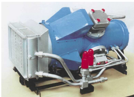
Рисунок 2 - Поршневой двухступенчатый компрессор сухого сжатия со встроенным электродвигателем 2ГМ-0,12/0,7-40С

Передвижная азотная компрессорная станция ПАКС-250 (рис. 3, а), на базе оппозитного поршневого 6-ти рядного 6-ти ступенчатого сухого компрессора воздушного охлаждения, которая укомплектована блоком газоразделения на основе полуволоконных полимерных мембран, для получения азотной газовой смеси.